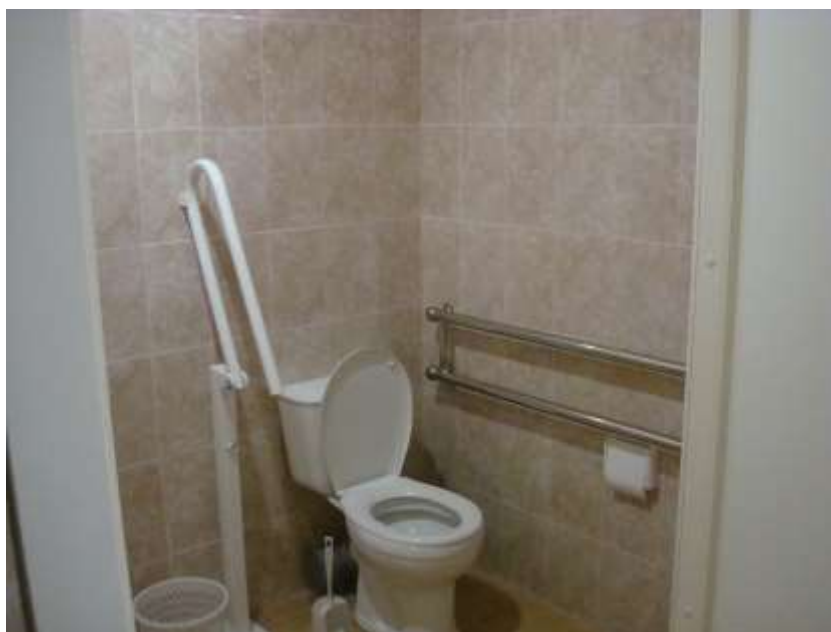
Фото 16. Туалетная комната увеличенного размера, для заезда в коляске, дверной проем увеличен, туалет оборудован специальными поручнями