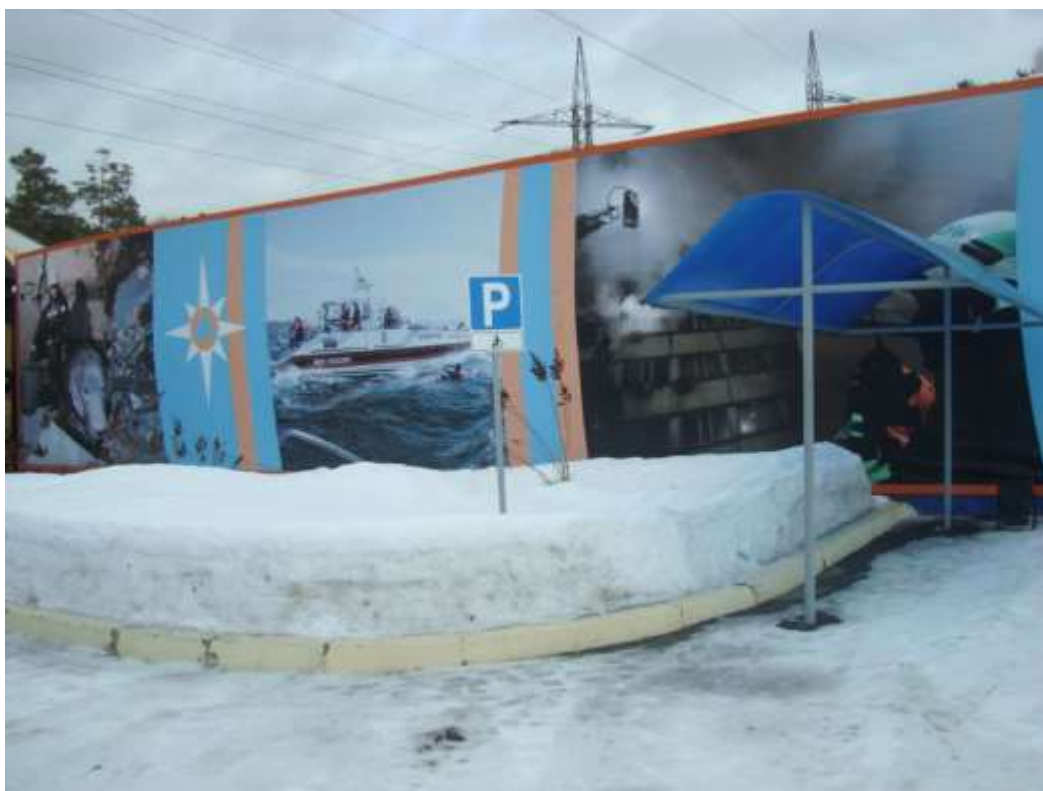
Фото 1. Место для парковки автомобильных средств, перевозящих людей с ограниченными возможностями.