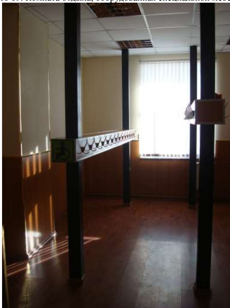
Фото 20. Специализированная гардеробная комната, вешалки расположены на доступной высоте