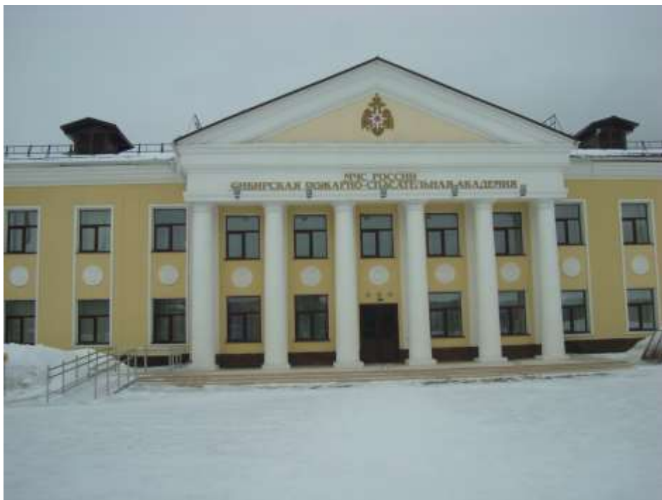
Фото 3. «Учебный корпус»