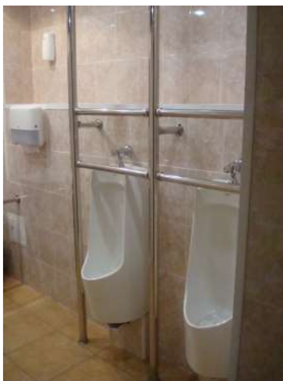
Фото 14. Оборудованные поручнями писуары, расположенные на регламентированной высоте.