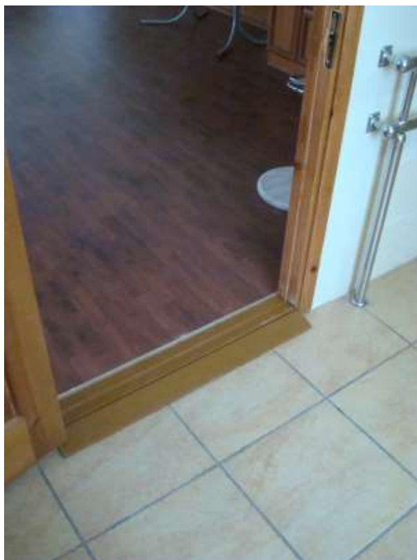
Фото 17. Все двери оборудованы удобными заездами