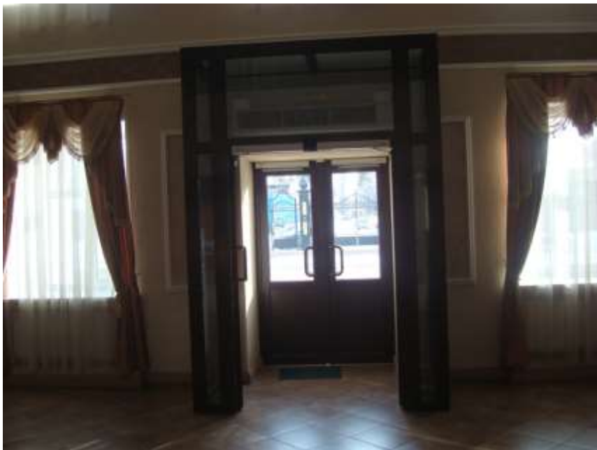
Фото 7. Автоматически открывающиеся двухстворчатые двери, тамбур, вестибюль, вид из здания