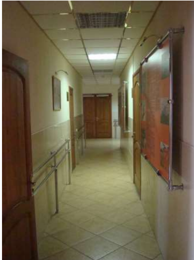
Фото 8. Оборудованный коридор до помещений по обслуживанию людей с ограниченными возможностями.