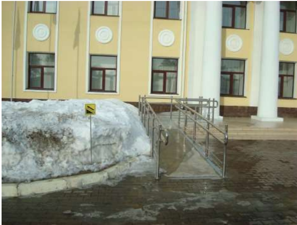
Фото 4. Пандус «Учебный корпус»