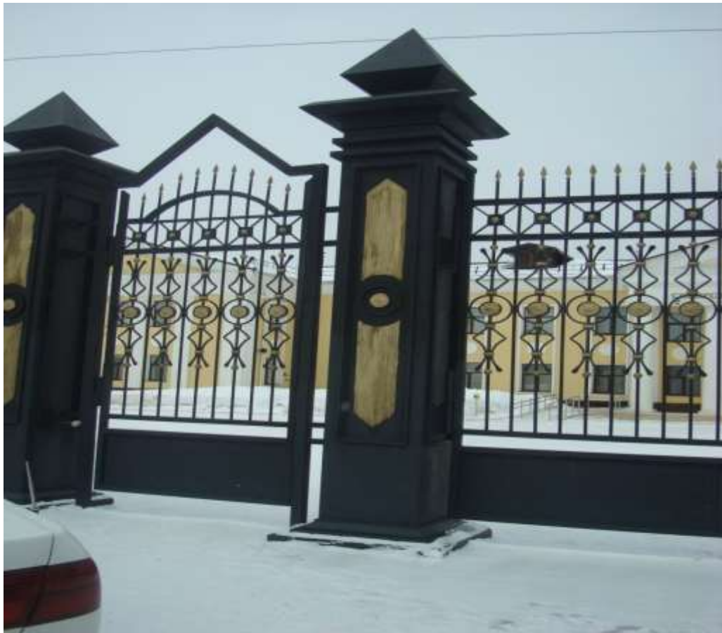
Фото 2. Вход на территорию Академии