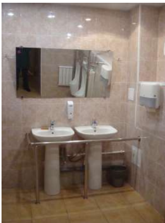
Фото 15. Оборудованные поручнями моечные, зеркало под специальным углом, приборы гигиены на доступной высоте