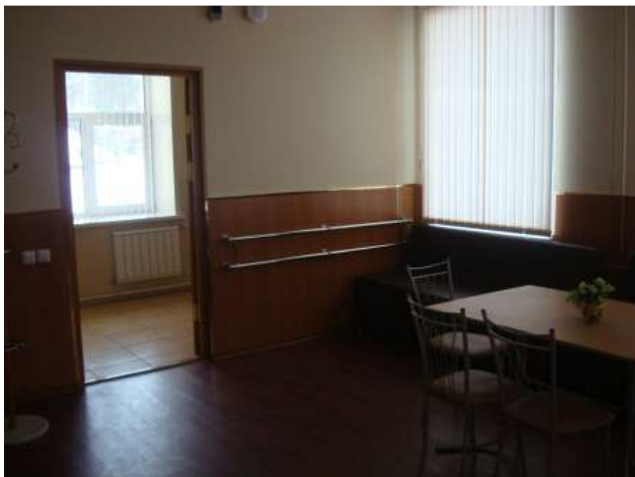
Фото 19. Комната отдыха, оборудованная специальной мебелью