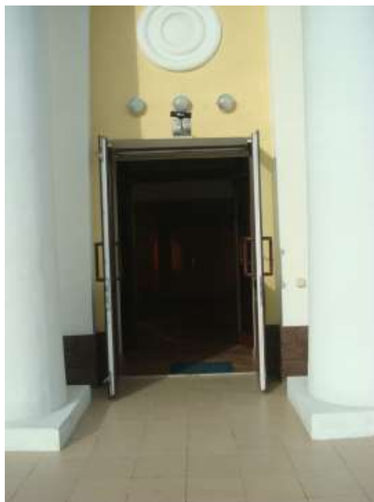
Фото 6. Автоматически открывающиеся двухстворчатые двери, вид с улицы