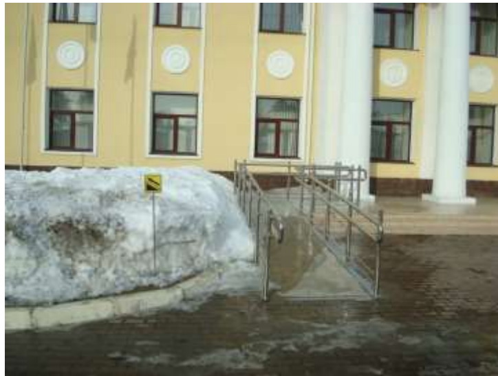
Фото 5. Пандус, лестница наружная