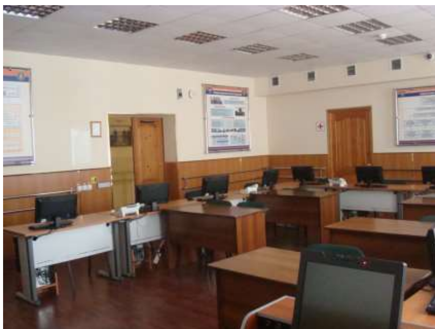
Фото № 13. Компьютерный класс для обучения людей с ограниченными возможностями