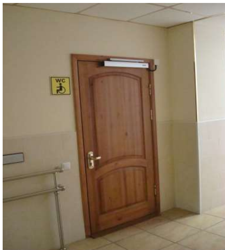
Фото 11. Специализированная туалетная комната