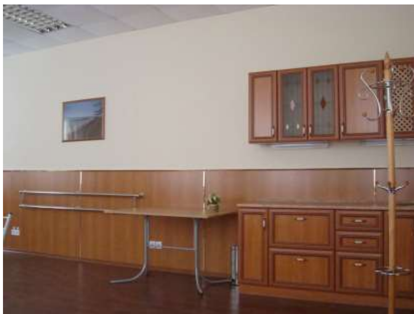
Фото 18. Комната отдыха, оборудованна поручнями